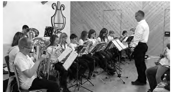
Das Vororchester eröffnete das Vorspiel mit viel Spielfreude

Wir Jugendleiter gratulieren zu diesem tollen Auftritt und freuen uns auf weitere Aktionen.